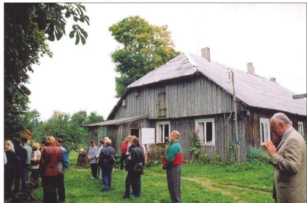
1 pav. Babrungo kaimo bendruomenės (Plungės rajonas) pastatų būklė 2005 m.